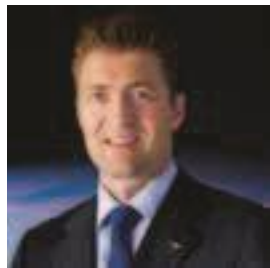
Tommaso Ghidini (托马索-辛迪妮) 欧洲航天局结构机械材料部负责人